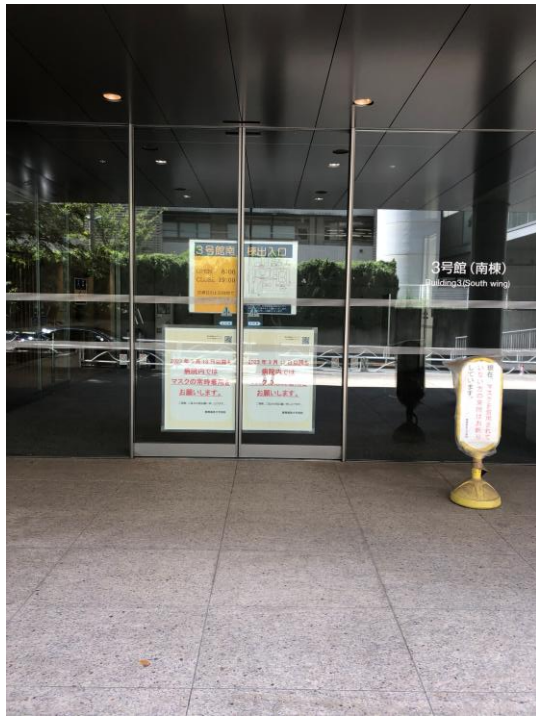
3号館南棟（病院）入口