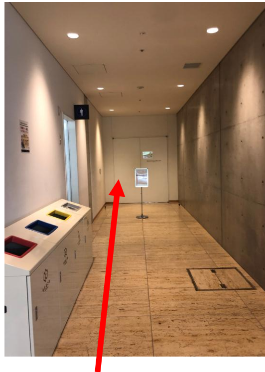
看板の先のドアを開けて左側が会場です。