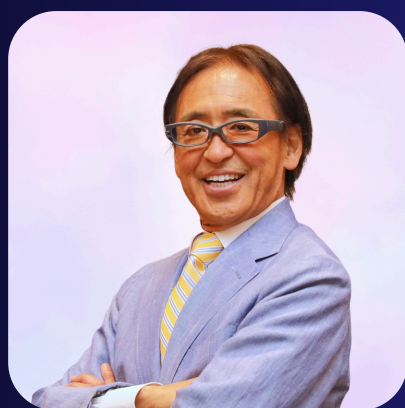
慶應義塾大学医学部発 ベンチャー協議会代表 株式会社坪田ラボ 代表取締役社長