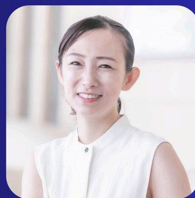
ARCH VENTURE PARTNERS Venture Partner